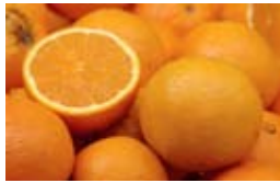
1 la naranja

e) Después de la explicación del profesor, escribe los nombres de estos productos: