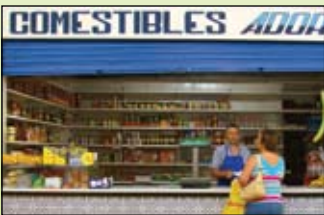
La tienda de comestibles